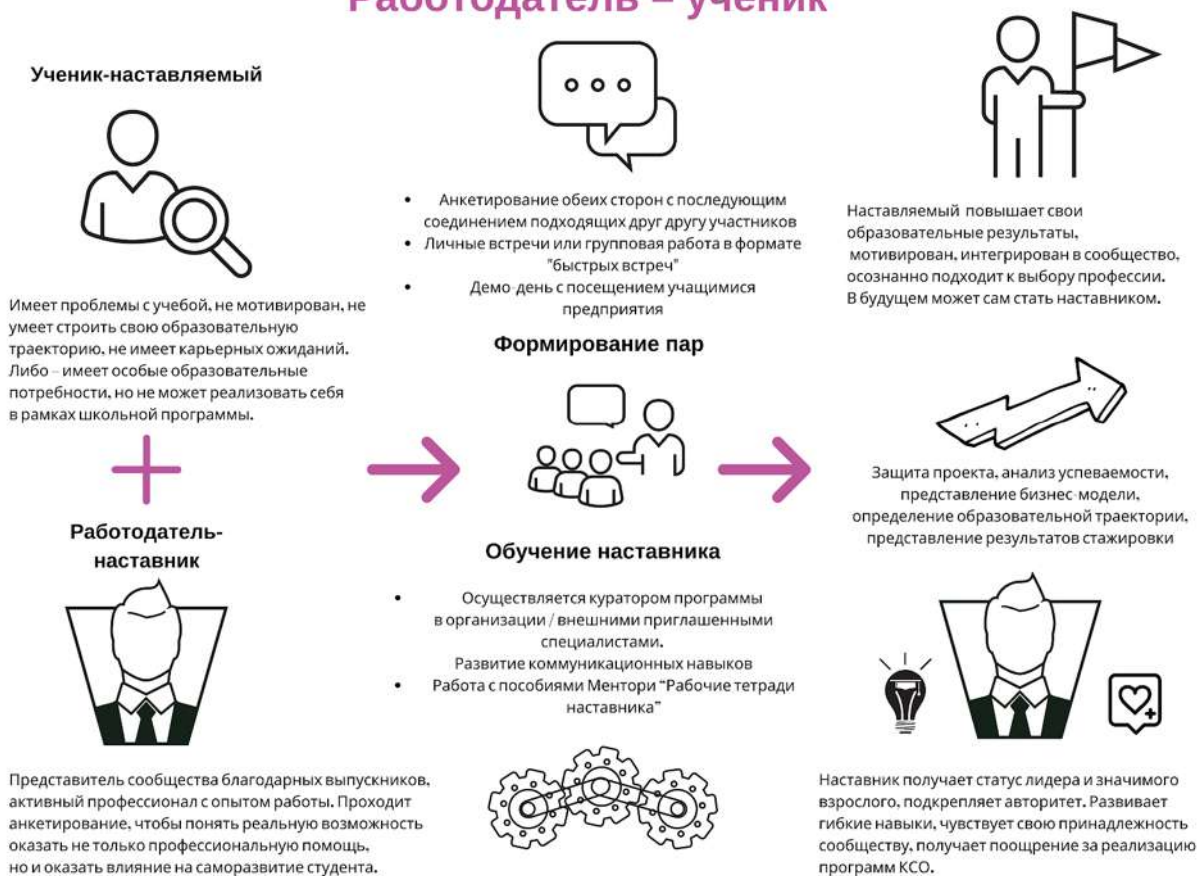
Рисунок 4. Графическое представление реализации программы наставничества по форме «работодатель – ученик».