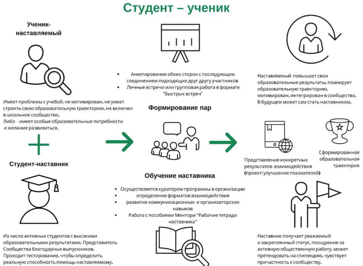
Рисунок 3. Графическое представление реализации программы наставничества по форме «студент – ученик».